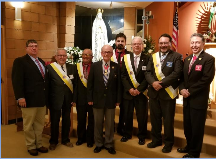
Consejo 15164- "San Felipe de Jesús" en Nogales, AZ., celebra por primera vez la Nueva Ejemplificación en la Caridad, Unidad, y Fraternidad.