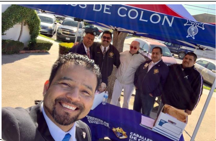
Nuevo Equipo del Desarrollo Hispano trabajando en el proyecto de Watsonville, CA