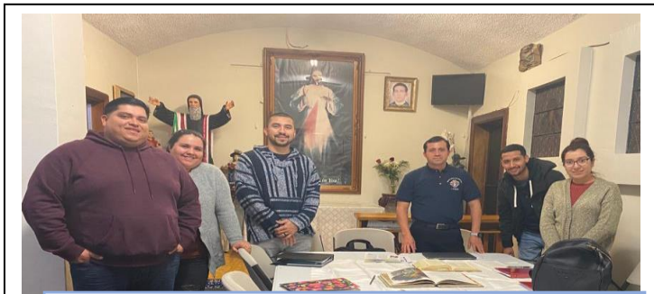
Consejo#17329-Guadalupe de Chino de Chino, CA., dando clases de catecismo a jóvenes para su programa Fe en Acción

Recuerde a sus Consejos que el pago de la cuota del Consejo Supremo de enero debe hacerse antes del 10 de abril. Los Consejos que no envíen su pago en esta fecha quedan en riesgo de ser suspendidos. Los delegados de los Consejos suspendidos no pueden participar en su convención estatal sino hasta que se restablezca el Consejo.