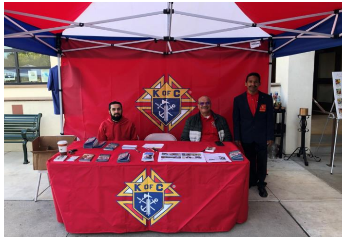
Consejo 15035- Sagrado Corazón de Cudahy, CA., participa en evento donde reclutaron 25 prospectos y un miembro

Envía una fotografía que muestre la vitalidad de la actividad de reclutamiento o de servicio a la comunidad junto con un breve relato de esta al correo electrónico misionfraternal@kofc.org para compartirlo en nuestro boletín mensual.