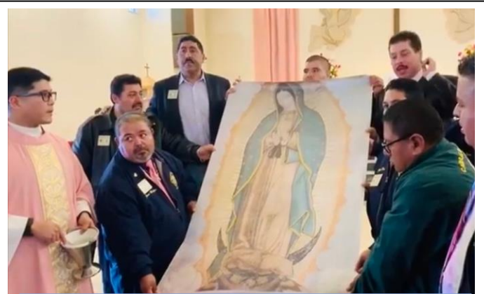
Consejo#17167- Sta. María de Natividad de Salinas, CA., muestra la imagen de Nuestra Señora de Guadalupe que ganaron de la iniciativa de membresía por alcanzar el 500% de reclutamiento.

Es de vital importancia para el bienestar de nuestra Orden que mantengamos un registro exacto de las donaciones y las buenas obras de caridad. Su diligencia es crucial para nuestro éxito en la recopilación de esta información. Póngase en contacto con todos sus Consejos para asegurar que completan el Informe Anual de Actividades Fraterales 2019 (# 1728-S) . El mejor método para la presentación de este formulario es mediante el uso de la entrega en línea, a la que se puede acceder a través de Funcionarios en Línea.